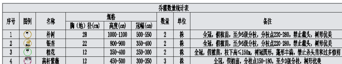
表 2.1-5 植被种植配置表（二）