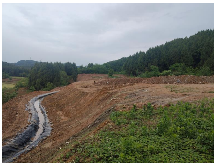
附图 2.4-2 土地整理现状