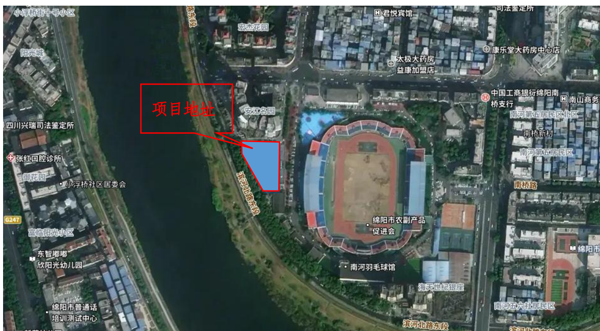
图 2.1-1 工程地理位置图

南河体育中心游泳综合馆重建项目位于涪城区体运村路6号南河体育中心内，北侧为安江名园小区，东侧为南河体育中心内部道路及室外羽毛球场，西侧为滨河北路东段，附近还有体运村路、南河路、饮马路等，交通便利（详见图2.1-1）。