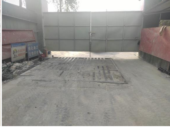
图 4.4-2 车辆清洗池