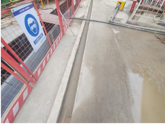
图 4.4-1 基坑排水沟