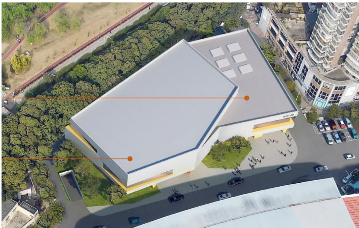
图 2.1-2 项目总平面布置效果图

侧为南河体育中心主要出入口，建筑形体变化使出入口处形成开阔空间，在北侧设置车库入口，南侧设置车库出口，单进单出，规范管理。沿新建建筑四周形成 4 米宽消防车道，最小转弯半径 9 米的消防车道，且与原馆内车行道连接。场馆主入口均为 1:20 平坡出入口，看台区设置无障碍电梯，无障碍座位。建筑内设置无障碍卫生间。本项目为因场地限制，未进行景观设计。项目在室外设置非机动车位 77 个。